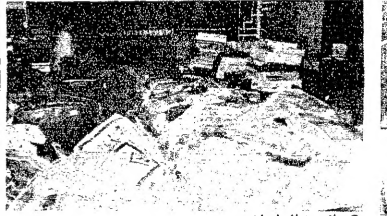
جانب من المساعدات